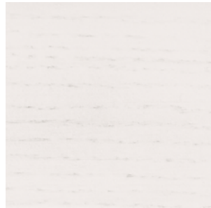
White Stained Oak