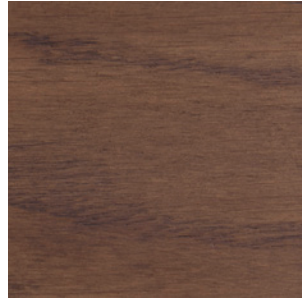
Ash Grey Oak