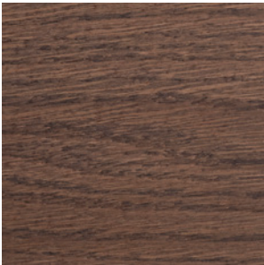
Walnut Stained Oak