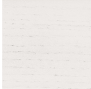
Walnut Stained Oak