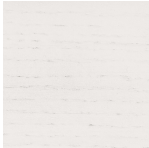
White Stained Oak